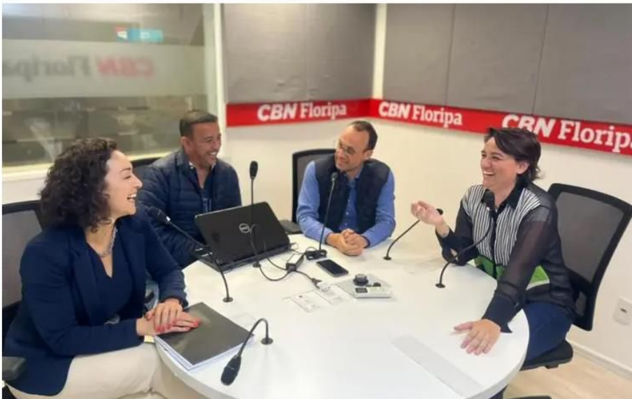
Debate sobre o Plano Diretor no Conversas Cruzadas

Já foi maior o otimismo em aprovar o Plano Diretor de Florianópolis em 2022. A eleição antecipada para a presidência da Câmara de Vereadores bagunçou o cenário. Até então, havia a convicção de que se tinha os votos necessários e prazos para a aprovação da matéria neste ano.