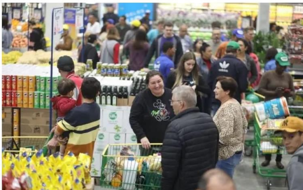
Brasil Atacadista abre a primeira loja em Joinville