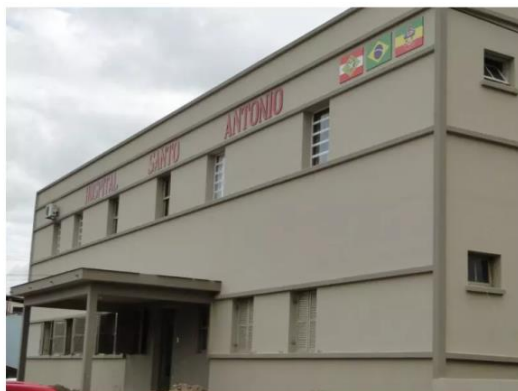
Desvios teriam ocorrido na gestão do Hospital Santo Antônio, em Armazém

Operação que apreende desvios de R$ 10 milhões no combate à pandemia tem novos alvos em SC