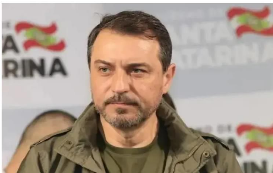
Carlos Moisés da Silva

05/10/2022 - 18h49 - Atualizada em: 05/10/2022 - 19h22