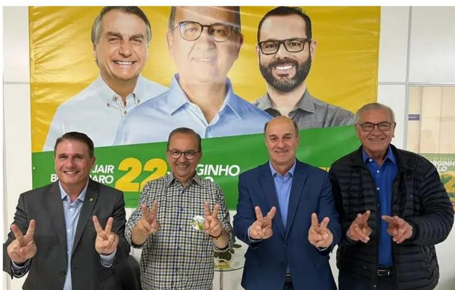
Jorginho recebe apoio de deputados do PP

O presidente estadual do Progressistas, deputado Silvio Dreveck, e a bancada estadual eleita do partido, declararam nesta quarta-feira (5) apoio a Jorginho Mello (PL) no segundo turno em Santa Catarina. O encontro ocorreu em Florianópolis, e foi marcado por uma ausência: a do senador Esperidião Amin.