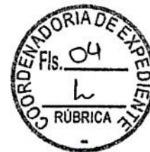
CARLOS CHIODINI Secretário de Estado